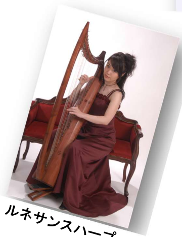
ルネサンスハープ